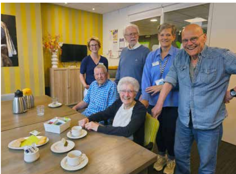
Deze foto zegt genoeg. Een stel gezellige mensen (van gevorderde leeftijd) treft elkaar iedere woensdag in de Buurthuiskamer van ZINN locatie De Brink.