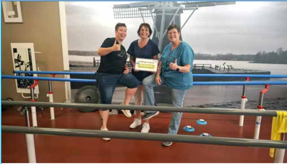
Team Mozart won de teamprijs.

Mail naar magazinn@zinnzorg.nl of geef uw tip door aan het servicepunt van ZINN via 050-585 2000 .