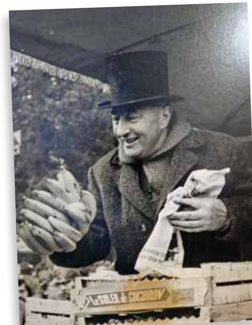
Aries schoonvader standwerker