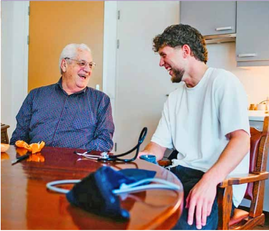
Sven Kramer