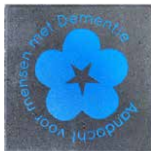
Een Vergeet Mij Niet Tegel